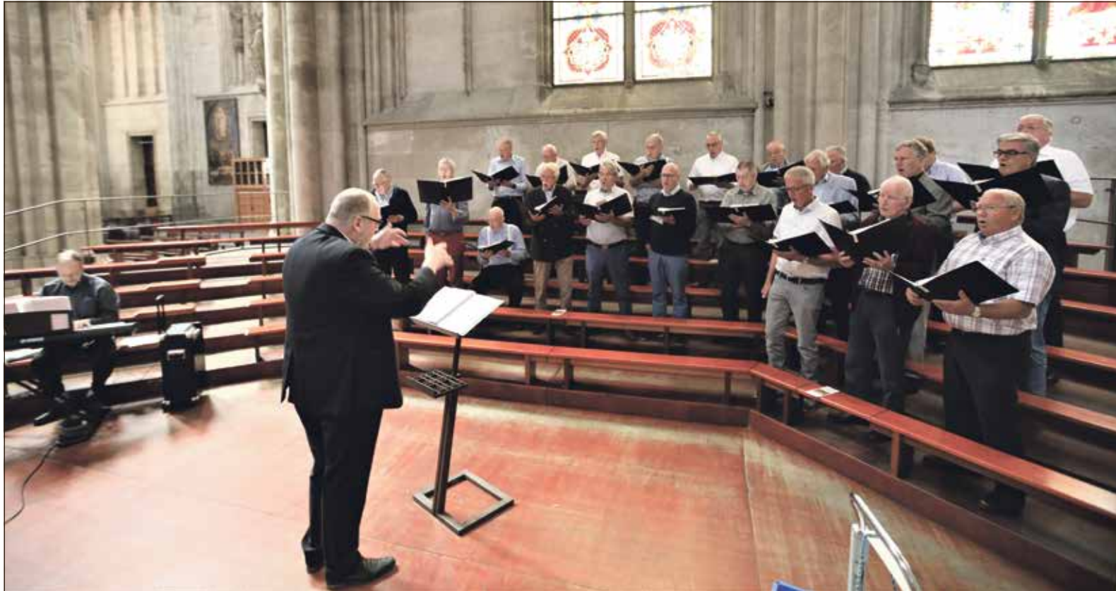
PAROCHIEEL MANNENKOOR MIERLO LUISTERT DE H. EUCHARISTIEVIERING OP IN DE 'KÖLNER DOM' F | HARRIE VAN DER SANDEN

Donderdag 14 februari 2019 34e jaargang nummer 7 www.demierlosekrant.com